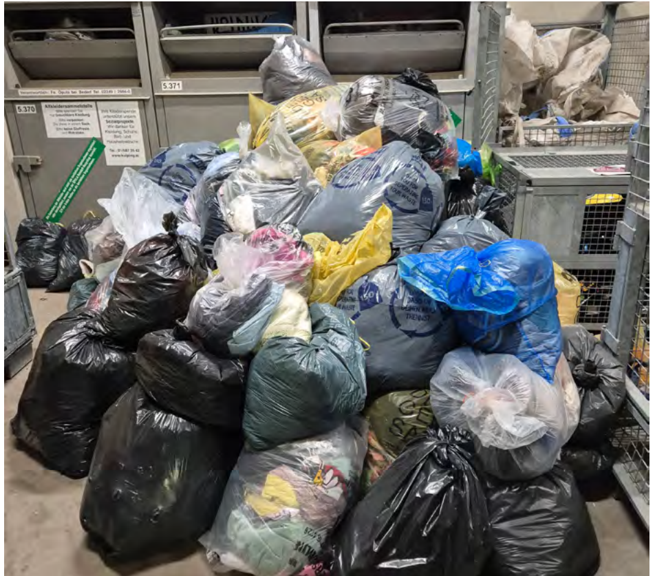
Solche Situationen sollen ab 2026 Geschichte sein – die Sammelmengen von Alttextilien nehmen kontinuierlich zu und überlasten die bestehenden Verwertungswege.

Kontinuierlich steigende Sammelmengen stellen uns vor neue Herausforderungen, auf die wir ab 2026 mit einer erweiterten Sammlung reagieren. Ab Jahresbeginn können die Alttextilien bereits zu Hause vorsortiert und damit der richtigen Sammlung mit den jeweils bestmöglichen Verwertungswegen zugeordnet werden.